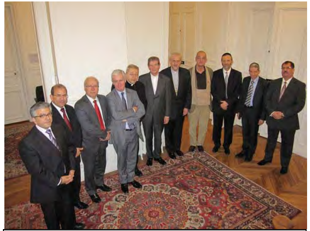
Les représentants des cultes en France